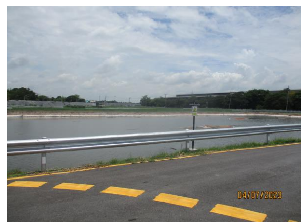
รูปที่ 11 บ่อตกตะกอน