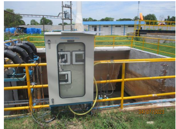
รูปที่ 9 ติดตั้งเครื่องตรวจวัดคุณภาพน้ำ Online