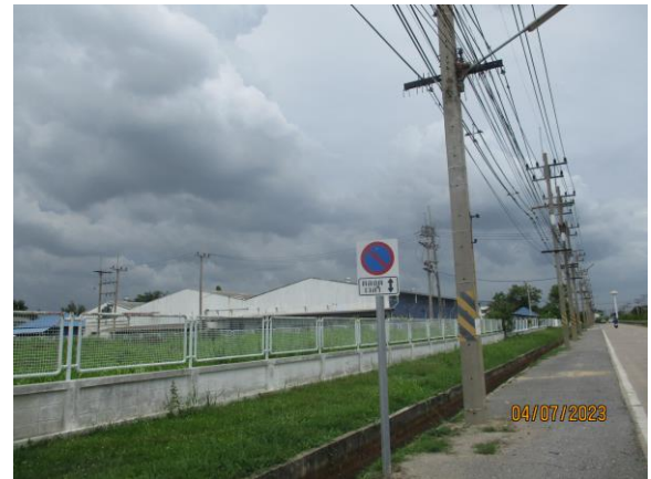
รูปที่ 21 ป้ายสัญลักษณ์จราจร