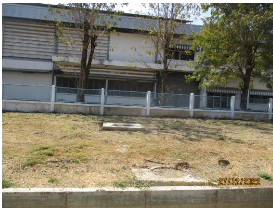
รูปที่ 4 Inspection Manhole