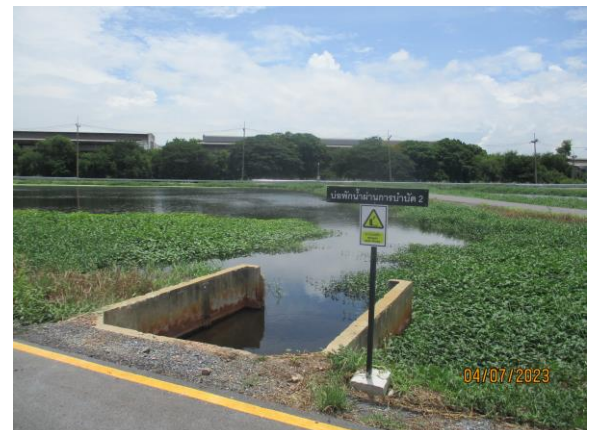
รูปที่ 10 บ่อพักน้ำทิ้ง