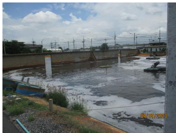
รูปที่ 6 ระบบบำบัดน้ำเสียส่วนกลาง