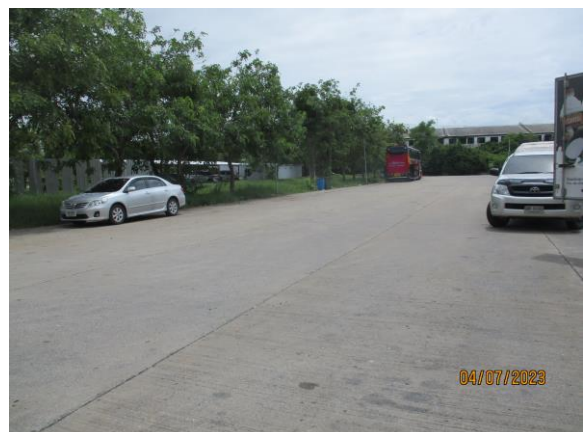
รูปที่ 17 พื้นที่จอดรถภายในโครงการ