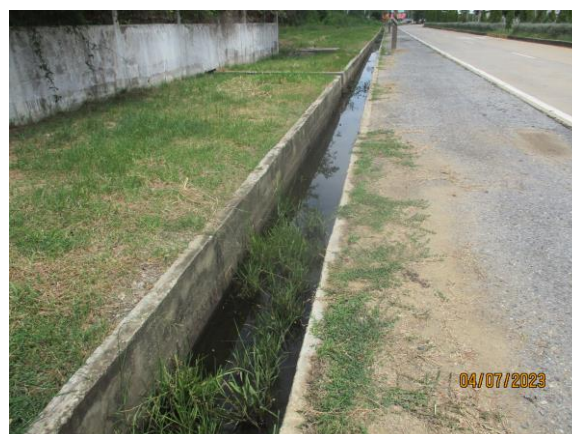
รูปที่ 5 รางระบายน้ำในโครงการ