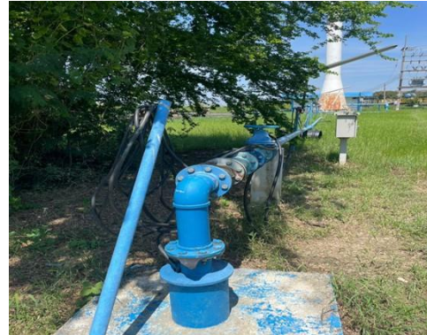
รูปที่ 24 บ่อบาดาลในพื้นที่โครงการ