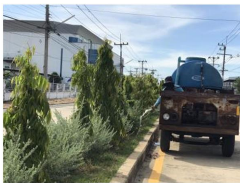
รูปที่ 8 รถบรรทุกน้ำในการรดน้ำต้นไม้