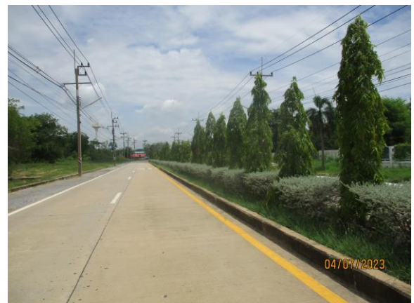
รูปที่ 2 พื้นที่สีเขียวของโครงการ