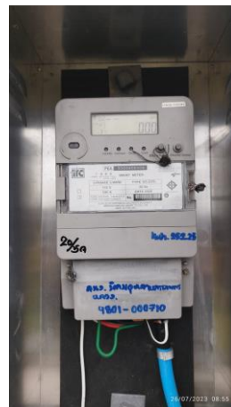
รูปที่ 7 มิเตอร์ตรวจวัดไฟฟ้าที่ระบบบำบัดน้ำเสียส่วนกลาง