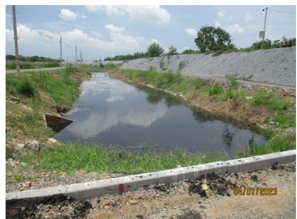
รูปที่ 14 คลองรองรับน้ำ