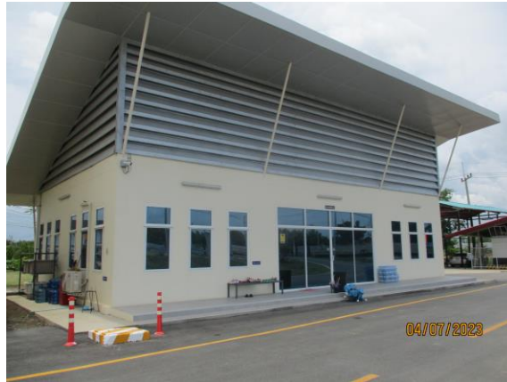
รูปที่ 12 ศูนย์ควบคุมน้ำเสียส่วนกลาง