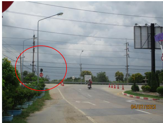
รูปที่ 19 สัญญาณจราจร