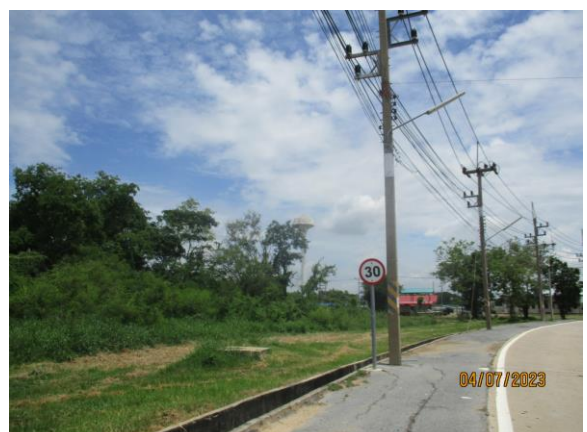
รูปที่ 20 ป้ายจำกัดความเร็ว