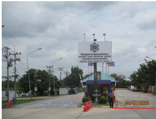
รูปที่ 22 สันนูนชะลอความเร็ว