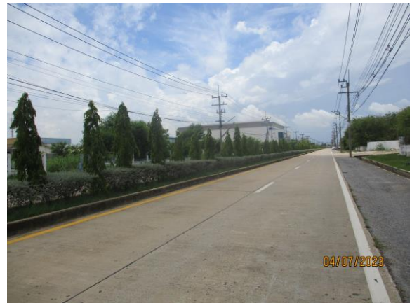
รูปที่ 18 ถนนภายในพื้นที่โครงการ