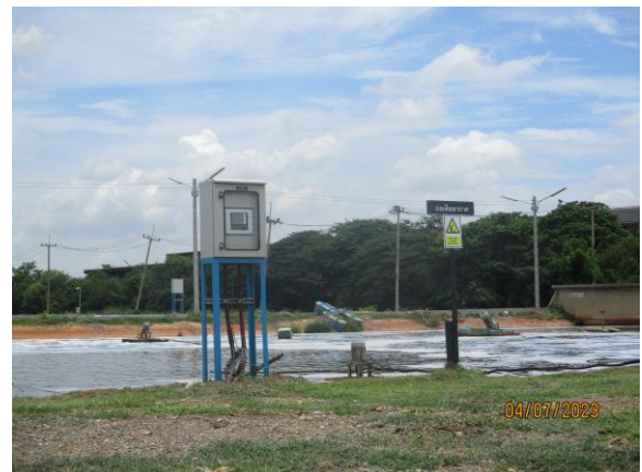
รูปที่ 13 ติดตั้ง Flow Meter