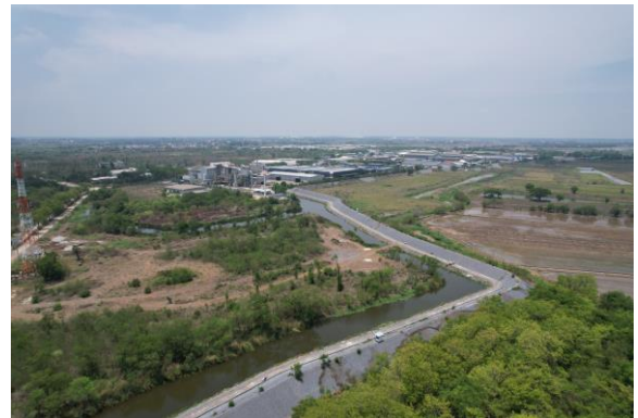
รูปที่ 15 คันทำนบป้องกันน้ำท่วม