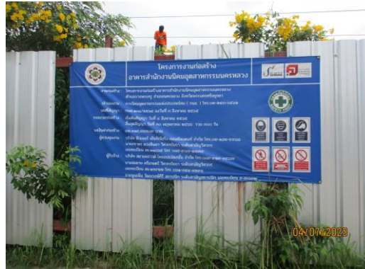
รูปที่ 5 ป้ายหน้าโครงการ