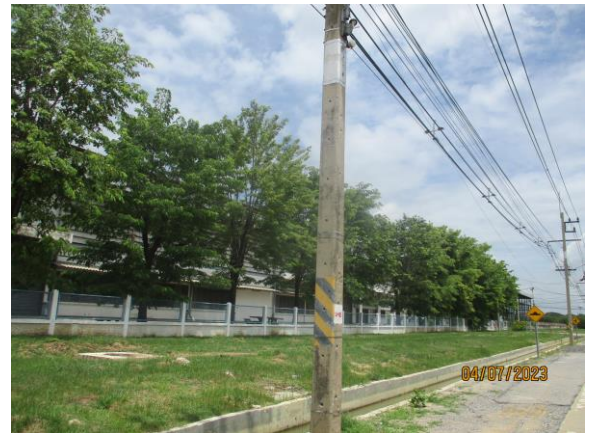
รูปที่ 1 พื้นที่สีเขียวของโรงงาน