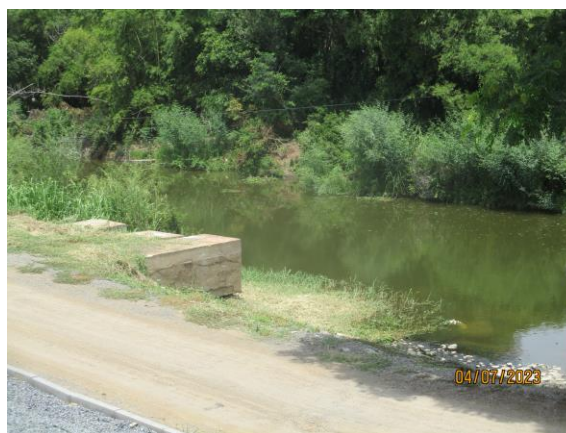
รูปที่ 23 ท่อชะลอแรงน้ำ