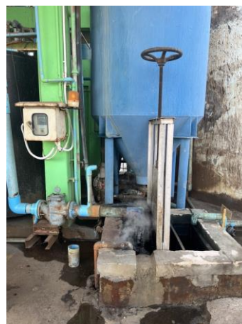
รูปที่ 3 ระบบระบายน้ำเสียของโรงงาน