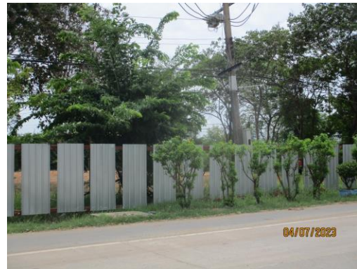
รูปที่ 6 ล้อมรั้วบริเวณพื้นที่ก่อสร้าง